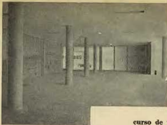
Entrada do Ambulatório.

vimento do Hospital; cursos de extensão e especialização em puericultura e clínica da 1ª infância — destinados a pós-graduados, estando o número de vagas e a duração de cada um na dependência das inscrições e das necessidades do ensino; curso de auxiliares de puericultura — com a finalidade de promover a formação de «atendentes» especializadas em puericultura, que freqüentarão as aulas durante dois anos, em turmas de 48 alunas, todas trabalhando como estagiárias, ministrando-se as aulas práticas na Pupileira, no Abrigo Maternal, no Hospital e na Cozinha dietética, e as teóricas no pequeno anfiteatro, projetado no bloco de ligação, junto ao Banco de Leite, e cuja capacidade é de 28 alunas;