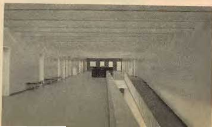
Sala de Espera do Ambulatório.

Discursando na inauguração do Instituto de Puericultura, afirmou o Sr. Presidente da República que, não obstante as dificuldades financeiras do País, que levaram o seu Governo a adotar uma severa política de compressão de despesas, foram levadas avante estas obras de tão alta destinação, sendo que dos 470 milhões de cruzeiros empregados na construção da Cidade Universitária desde 1945, cerca de 400 milhões o foram durante o atual Governo. Prosseguindo, de-