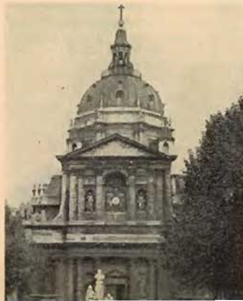
Universidades Francesas "LA SORBONNE"