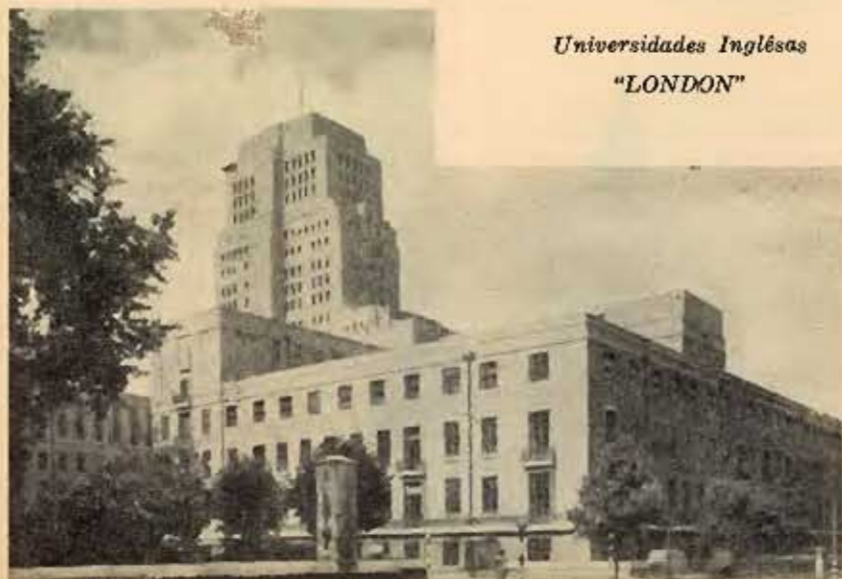
Universidades Inglesas "LONDON"

De Estocolmo, os representantes da CAPES voaram para Londres, onde foram recebidos oficialmente pelo British Council, o qual, através de um cuidadoso e bem organizado programa, lhes proporcionou ligação com as Universidades de Londres, Oxford e Cambridge, que foram visitadas demonstradamente pelos nossos representantes, sempre com o auxílio dos representantes do British Council. Os quinze dias de permanência na Inglaterra foram de extremo interesse para conhecimento dos problemas universitários ingleses e discussão das possibilidades de intercâmbio entre a CAPES e as universidades brasileiras de um lado, e o British Council e as universidades inglesas e centros de pesquisa daquele país, de outro.