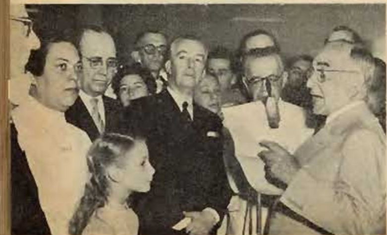
O Sr. Presidente da República discursando na inauguração do Instituto.

Dirigida por um médico-chefe, a Divisão de Ensino do Instituto estará incumbida, entre outras atividades, dos seguintes cursos: de formação — que faz parte do currículo escolar da Faculdade Nacional de Medicina e, de conformidade com o atual regime, será ministrado em turmas de cinquenta alunos da 6ª série, com a duração de dois meses para cada turma. As aulas práticas desse curso serão dadas no Ambulatório, no Hospital, no Abrigo Maternal e na Pupileira, devendo as aulas teóricas ocupar o anfiteatro construído no primeiro pa-