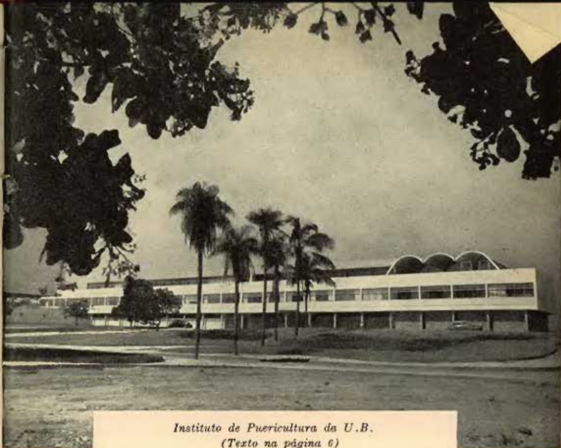
Instituto de Puericultura da U.B. (Texto na página 6)