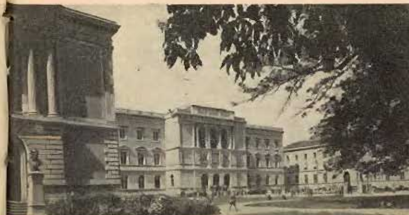
Universidades Suíças "GENÈVE"

Iniciando a viagem por Portugal, a missão da CAPES visitou naquele país, além do Ministério da Educação Nacional, o Instituto para a Alta Cultura, que centraliza ali tudo que se refere a intercâmbio universitário e bolsas de estudo, a Faculdade de Medicina, a Faculdade de Ciências Econômicas, o Laboratório Nacional de Engenharia Civil, o Instituto Superior de Ciências Econômicas e Financeiras, a Estação Agronômica Nacional (localizada em Sacavém), o Instituto Nacional de Oncologia, o Instituto Superior Técnico, o Hospital Escolar (em construção) e o Hospital Santa Marta, em Lisboa. Em Coimbra, foram visitadas as distintas Faculdades que compõem a Universidade e o Hospital anexo à Faculdade de Medicina.