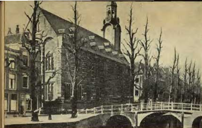
Universidades Holandesas "LEIDEN"

Como resultado dessa visita, foi feita a articulação com o Instituto para a Alta Cultura e a Direção do Ensino Superior no que diz respeito ao intercâmbio de professores entre o Brasil e Portugal e um estudo da organização geral do serviço de bolsas naquele país e da possibilidade de colaboração das autoridades universitárias portuguesas no tocante à localização, em Portugal, de bolsistas brasileiros.